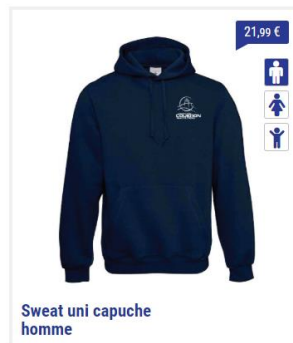
Sweat uni capuche homme