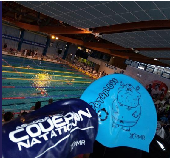
Pataplouf aux Championnats de France Maîtres N2 Angers 27-28-29/02 et 1/03/2020