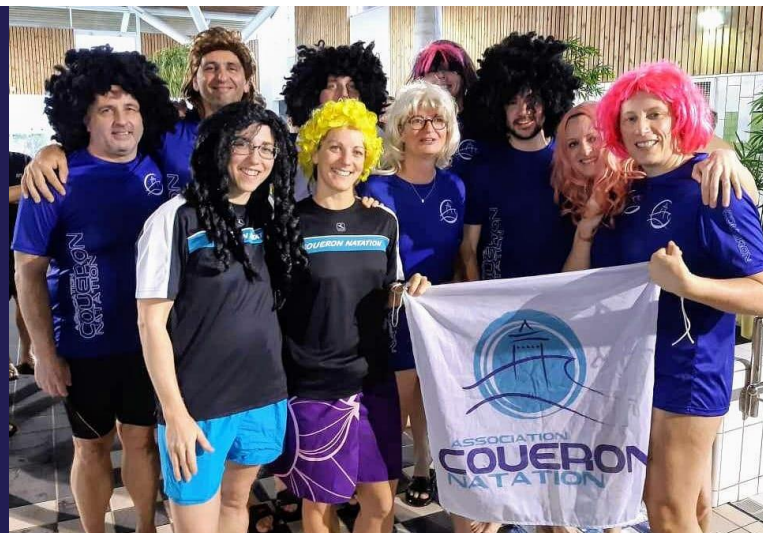
Interclubs Maîtres Les Sables d'Olonne 2/02/2020