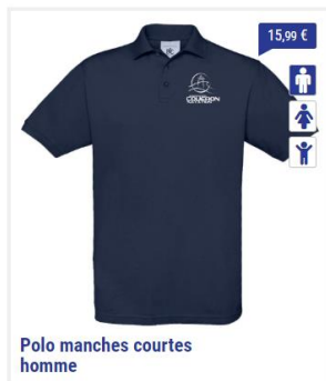
Polo manches courtes homme