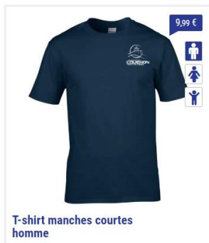
T-shirt manches courtes homme